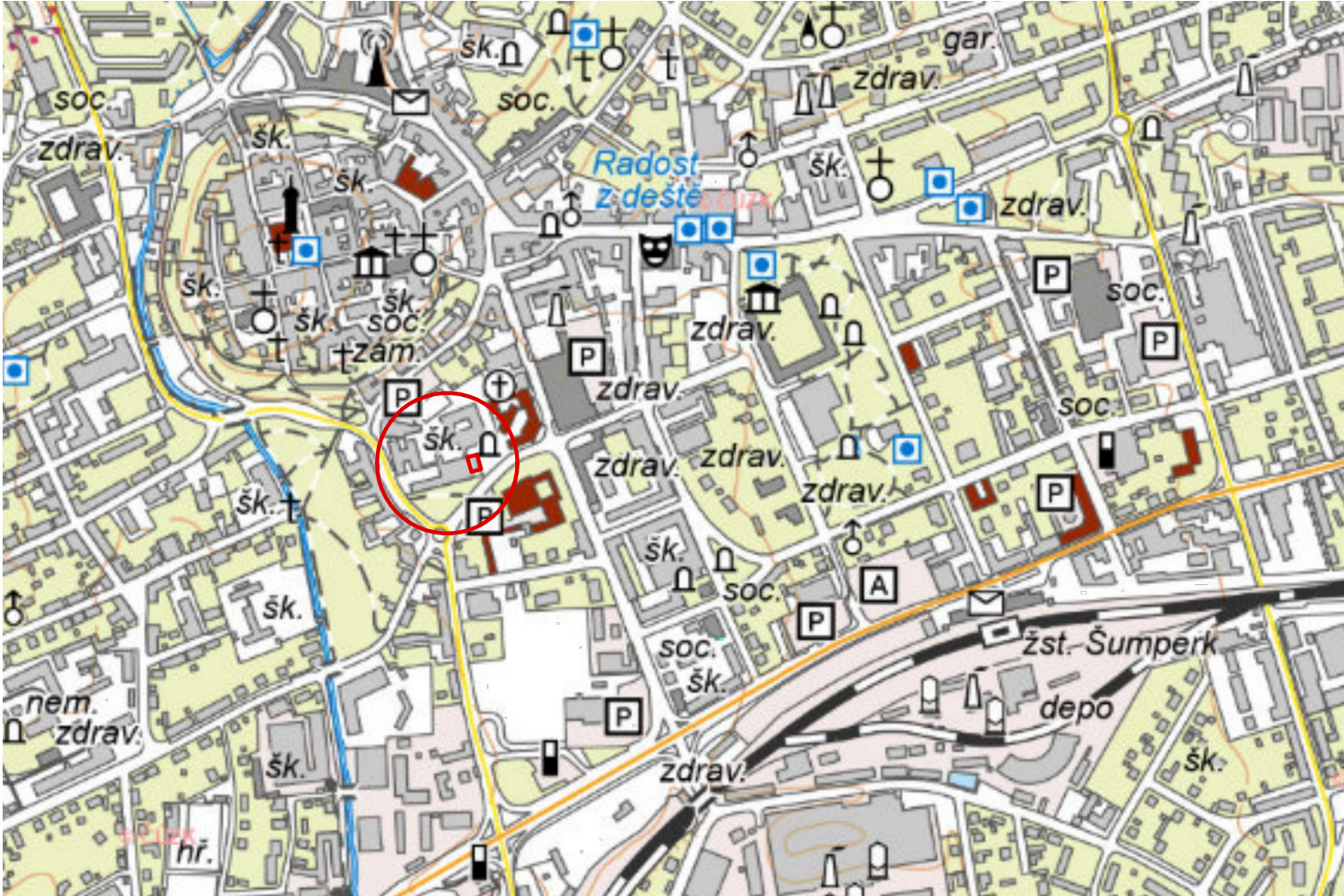
VÝŘEZ Z MAPY, M 1:8000